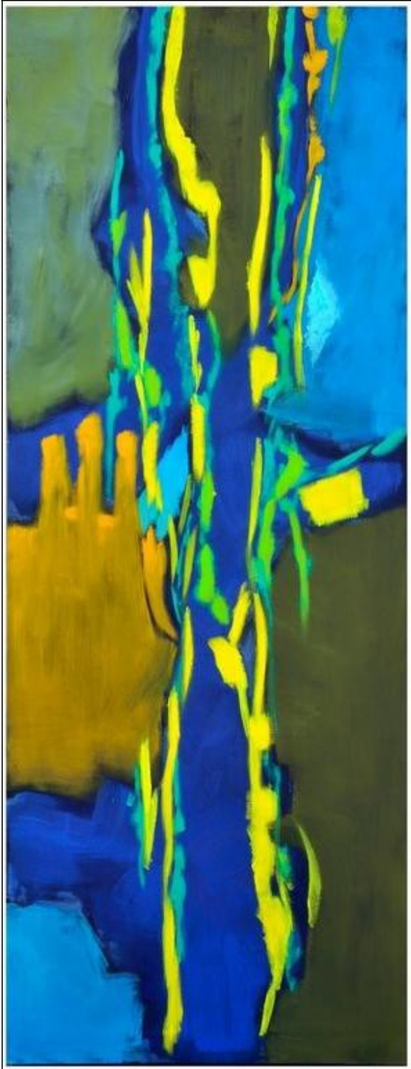
Schon wieder kein Rot 184 x 71