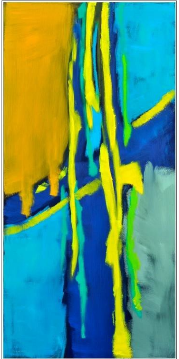
Nochmal kein Rot 125 x 58