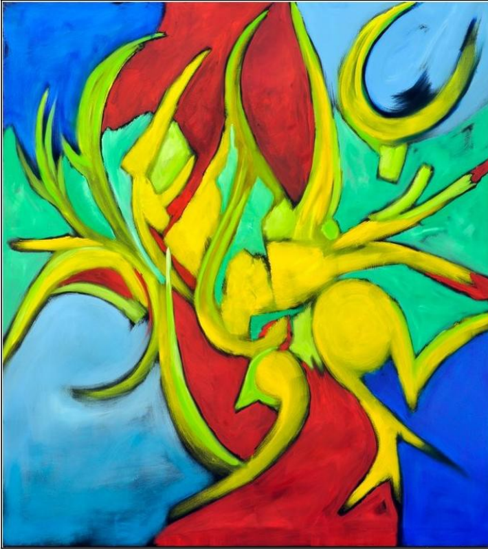
Schneekristalle 161 x 148

Auswahl der Ausstellung " Dream Blossoms " - Dashanzi 5 / 10