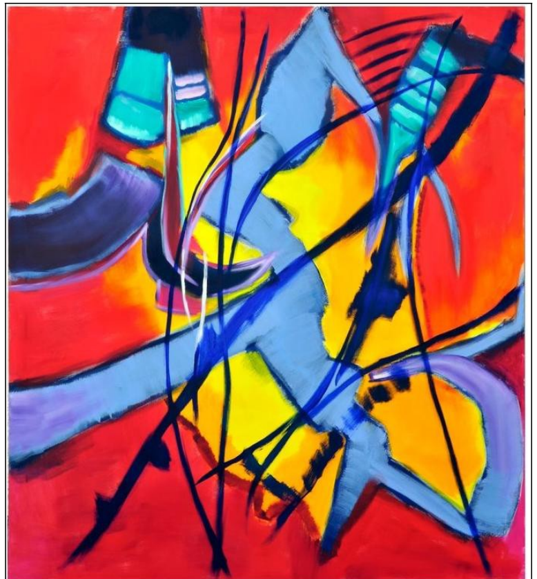
Eiskristalle 161 x 148