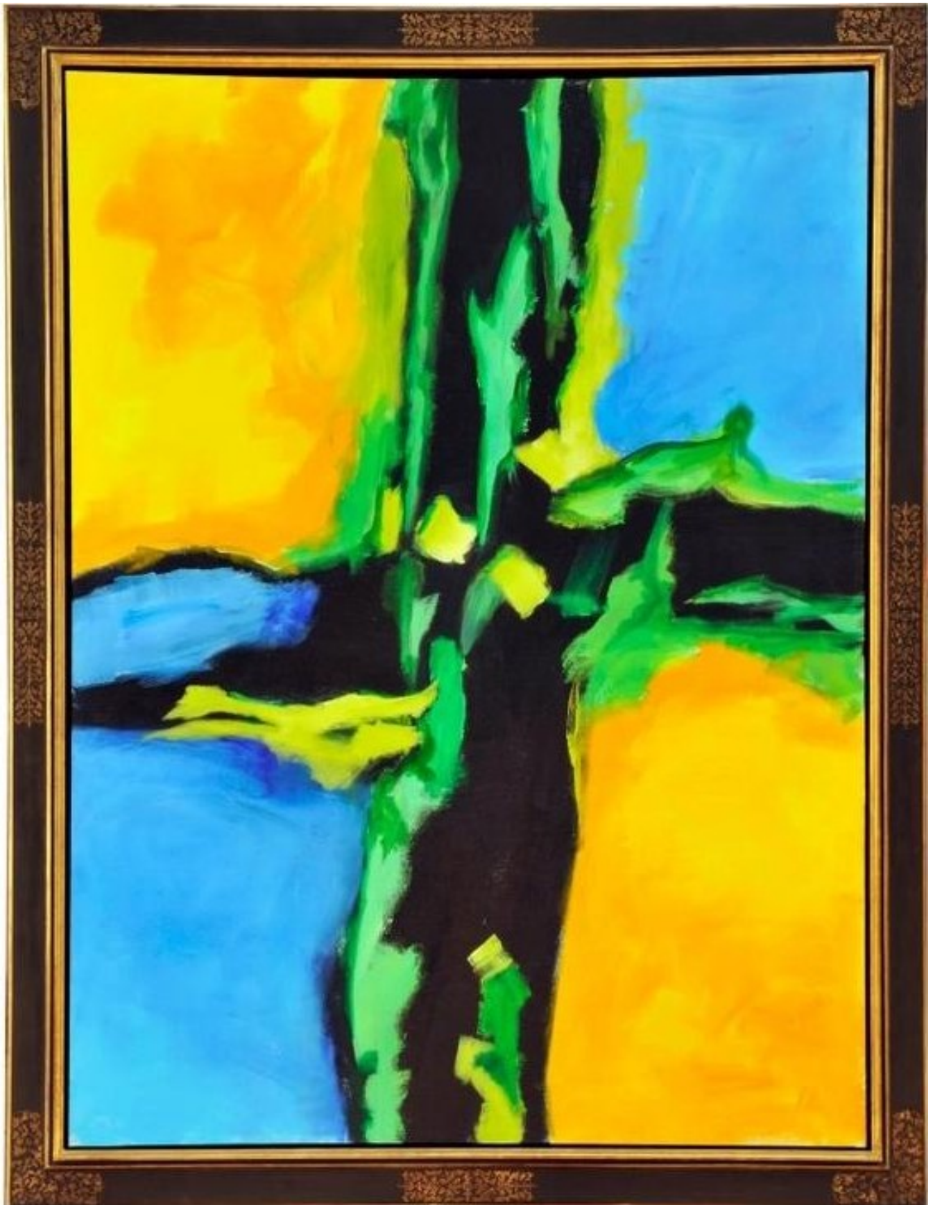
Frühling der überaus grüne 215 x 171